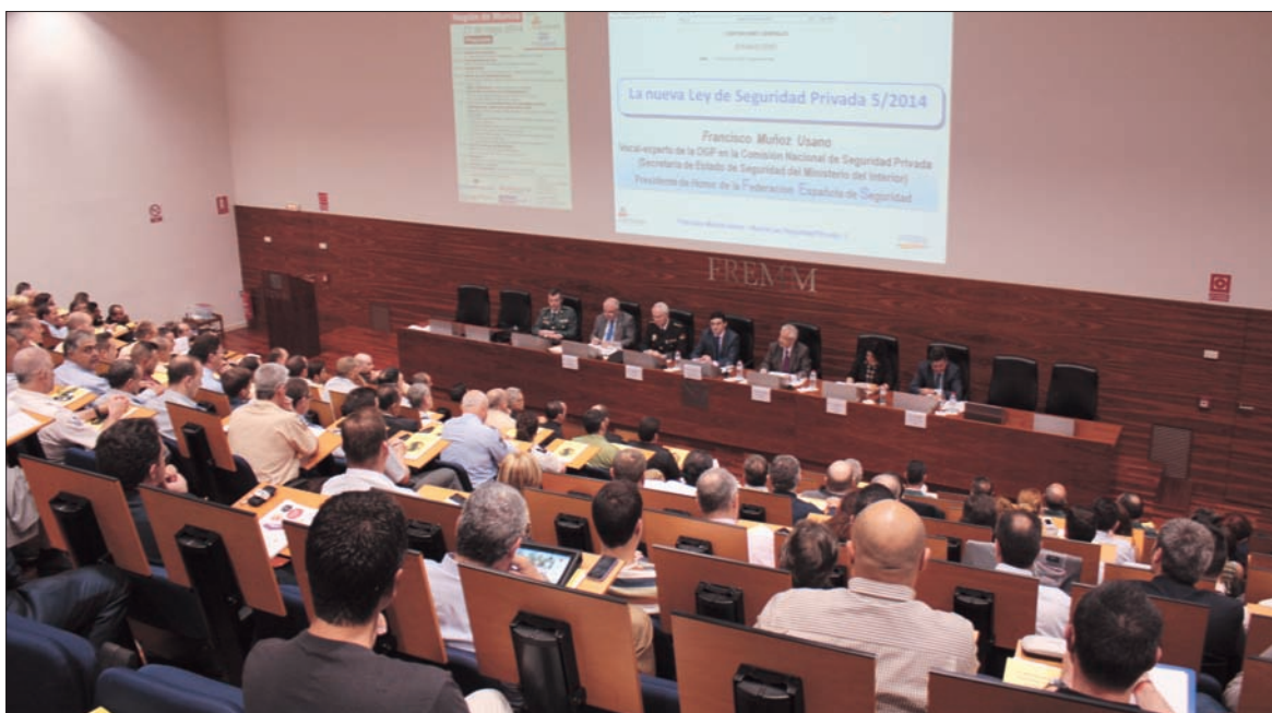
ÉXITO. El “Día de la Seguridad Privada” contribuyó a reforzar aún más la cooperación entre las empresas privadas de vigilancia y las fuerzas del seguridad del Estado.

autoridad en determinados casos, y de liberalizar determinados requisitos en las comunicaciones de las instalaciones de los sistemas de seguridad.