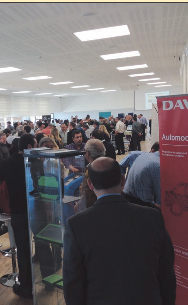
mo consecuencia del grado de implicación de sus empresarios.