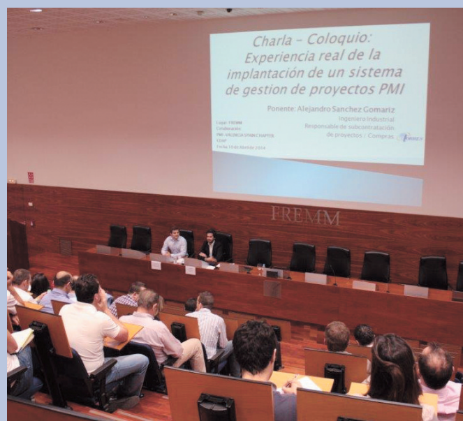
PROVECHOSA. Los empresarios compartieron vivencias.