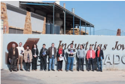
Contacto entre las empresas de FREMM.

Una decena de empresas de FREMM han visitado Industrias Jovir SL, de recubrimientos metálicos, con 35 años de trayectoria, para conocer las claves de su éxito. Los empresarios recorrieron sus instalaciones, la planta de galvanizado y una automatizada instalación de pintura termolacada en polvo para realizar cualquier tipo de recubrimiento de pintura