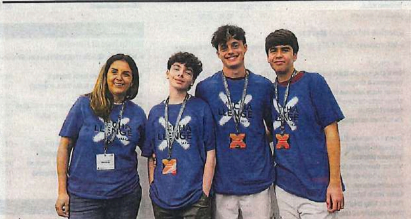
Tres alumnos del IES Francisco Salzillo de Alcantarilla junto a una docente.

La Escuela Técnica Superior de Arquitectura y Edificación de la Universidad Politécnica de Cartagena fue la organizadora de las jornadas.