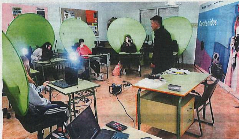
Uno de los cursos sobre creación de contenidos audiovisuales.

► El periodo de inscripción para acceder a ellos ya está abierto y se podrá solicitar durante lo que queda de curso escolar y principios del siguiente