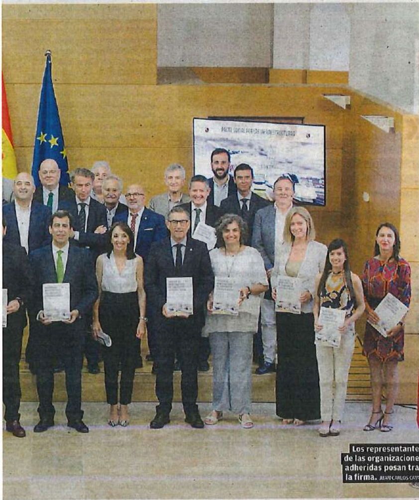
Los representantes de las organizaciones adheridas posan tras la firma. JUAN CARLOS CAVAL

Dice que hay que ver las inversiones lejos de «la óptica política, porque el periodo de maduración es largo»